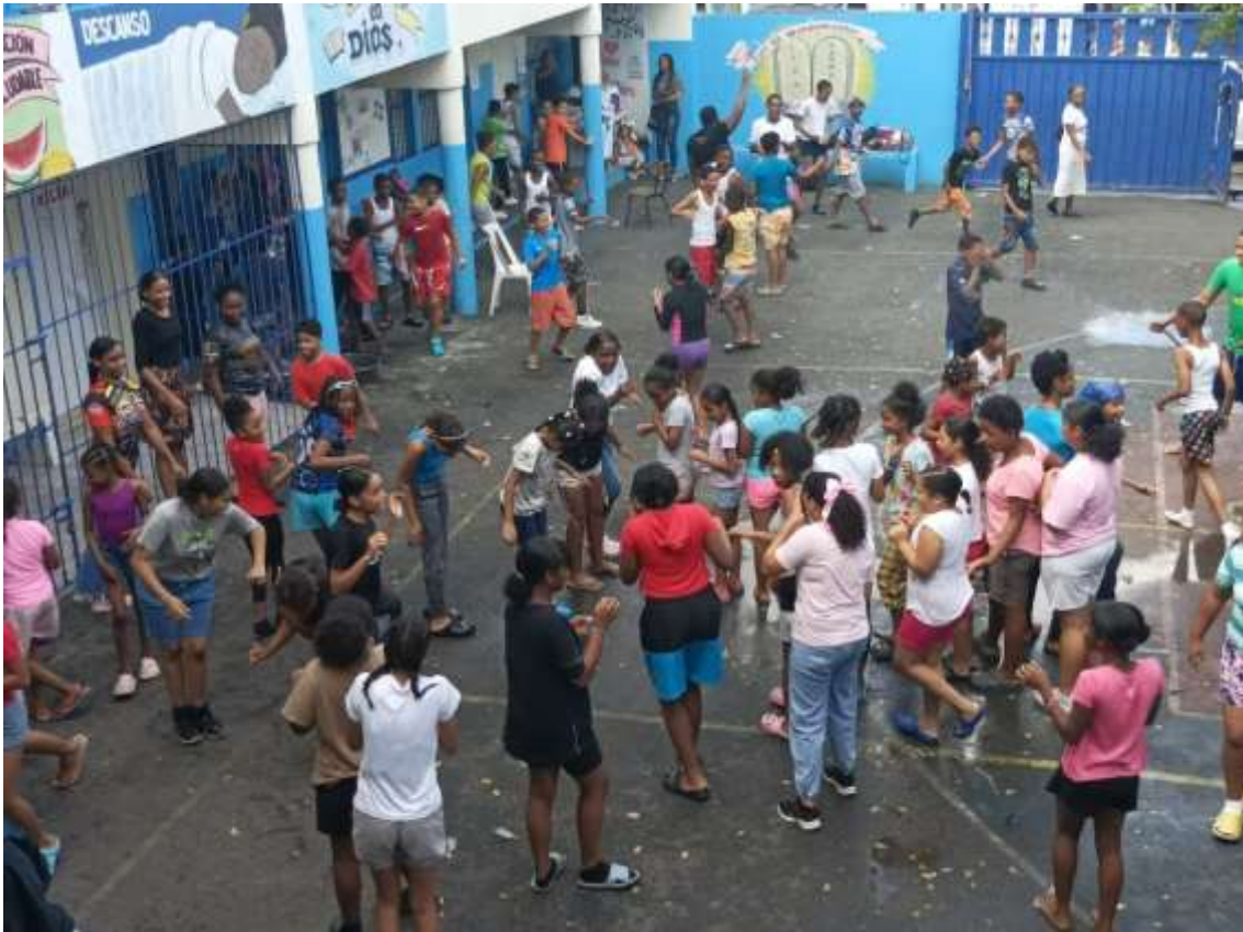
Niños en actividades juveniles 2024

Se formó el club, se ha obtenido un ejemplo