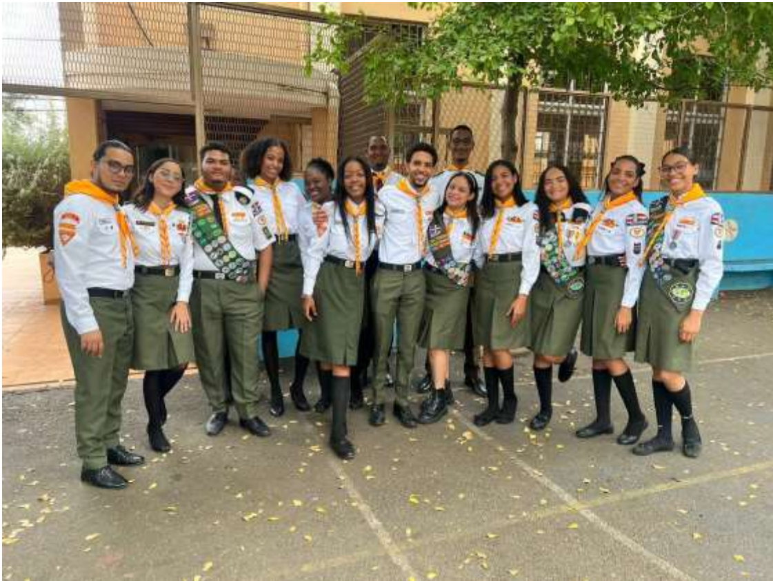
Junta Directiva Clubes de Conquistadores Los Minas Central 2024