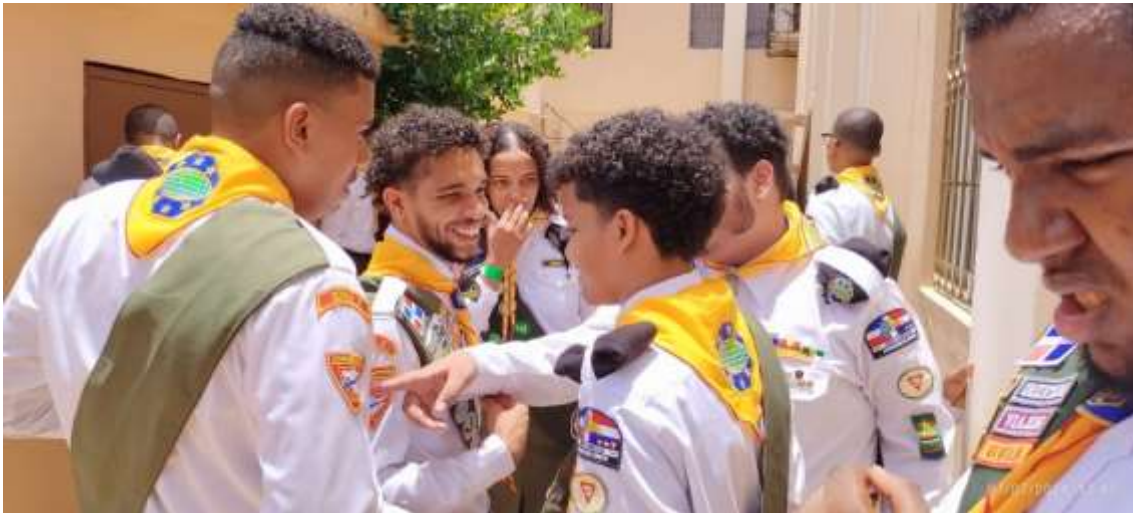
Programas de evaluación a los conquistadores de los 60 aniversarios del Club Los Minas 2024.