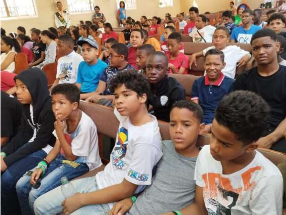
Los niños del sector orientados por los Líderes Juveniles del Club Marzo 2024.