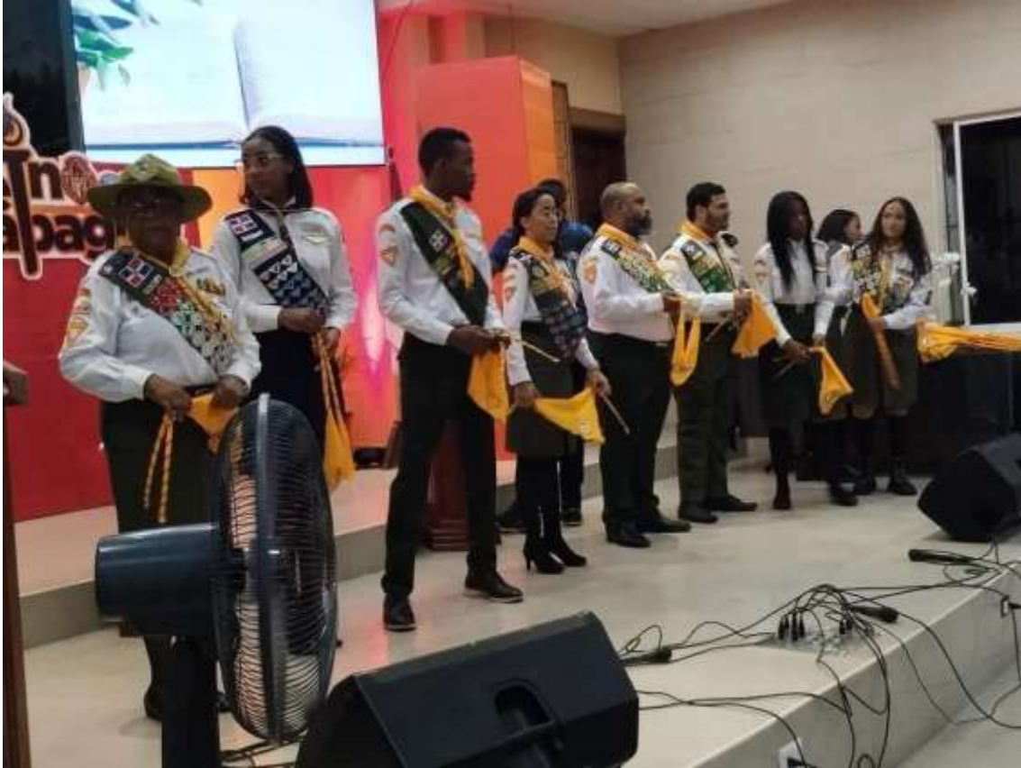
Lideres Principales de la Junta Directiva del Club de Conquistadores del 2024.