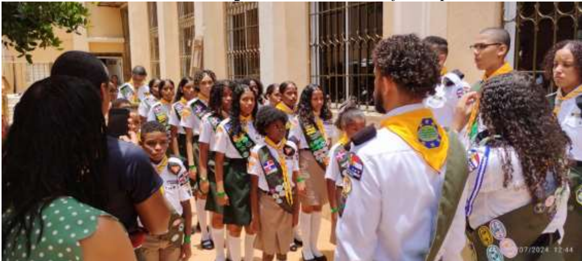
Evaluación Periódica Club los Minas en Precamporee 2024

Los Minas se mantuvo siempre arriba hasta la fecha predomina.